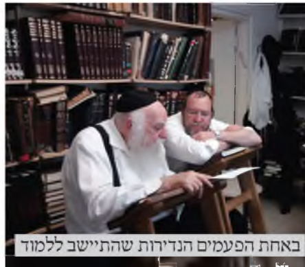
באחת הפעמים הנדירות שהתיישב ללמוד

מצד אחד היה מחדש עצום, כאשר היה יכול לתרץ מיסוד שמצא באגדה תירוץ להלכה, כי