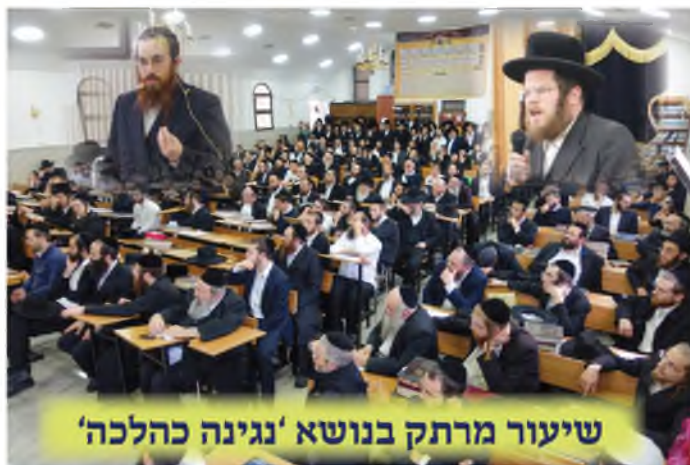
שיעור מרתק בנושא 'נגינה כהלכה'

שְׁהַלְלֵ: מבוואר בגמ' (ברכות דף מ: ורש"י שם ד"ה מירבא) ונפסק ברמב"ם (ברכות פרק ח הלכה ח), ובשו"ע (סימן רד סעיף א), על כמהין ופטריות מברך שְׁהַלְלֵ. למרות שנחשבים גידולי קרקע (שהנודר 'מפירות הארץ', אסור בפירות הארץ ומותר בכמהין ופטריות, ואם אמר 'כל גדולי קרקע עלי' אסור אף בכמהין