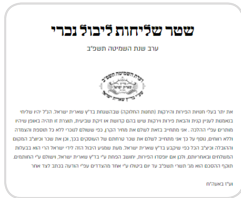
"...מעת שמגיע היבול הזה לידי ישראל הרי הוא בבעלות המשלחים ובאחריותם, ולכן אם יופסדו הפירות, יחושב הפחת ע"י בר"ץ שארית ישראל, וישולם ע"י החותמים"