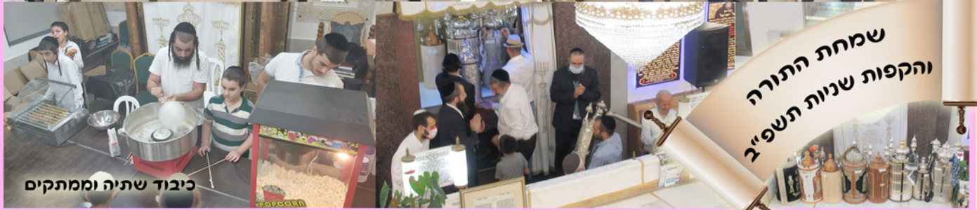
כיבוד שתיה וממתקים