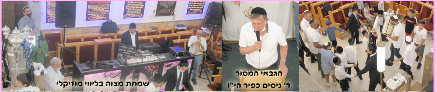
שמחת מצוה בליווי מוזיקלי