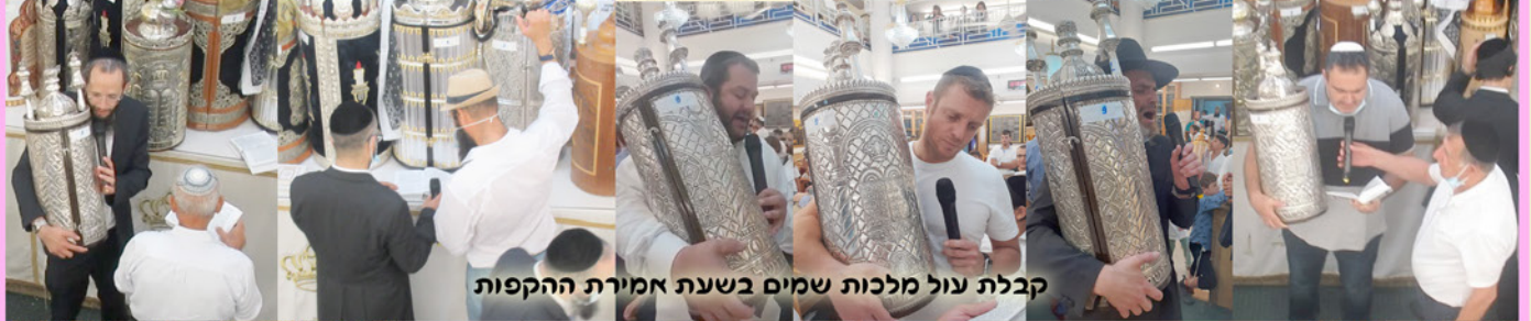
קבלת עול מלכות שמים בשעת אמירת ההקפות