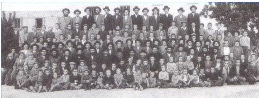
עם אחיו בעל הי'אמרי חיים' זצ"ל