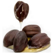
אגוז החוחובה מכיל 54% שמן

גם אם בשמיטה שעברה יכולנו להשתמש כרגיל במוצרי קוסמטיקה ללא השגחה, בשמיטה הנוכחית נצטרך כנראה לנהוג אחרת. על מה ולמה? על כך ועוד במאמר שלפניכם.