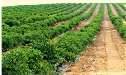
כיום בארץ 25,000 דונם (!) מטעי חוחובה

אלא שעד השמיטה הנוכחית לא היה ביטוי במציאות לחילוק בין שנת השמיטה לשאר שנים, מפני שכמעט לא היה נמצא שמן העומד לסיכה מגידולי הארץ שנעשה בו שימוש במוצרי קוסמטיקה.