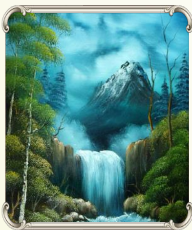
אברהם אבינו חפש את ה' בבריאה, ואזי הציץ עליו בעל הבירה. ה' ממתין שנחפש אותו...

הבה נתבונן באברהם אבינו, שיצא מההרגל של כל העולם, פמובא במודש שפאשר ראה אברהם אבינו את השמש, הוא התבונן מה מניע את השמש. הן אמת שכל בני דורו ראו את הבריאה הנפלאה, אבל הם לא עצרו להתבונן, הם המשיכו לחיות את עניי העולם מתוך ההרגל בעבודות וכמבע יבש.