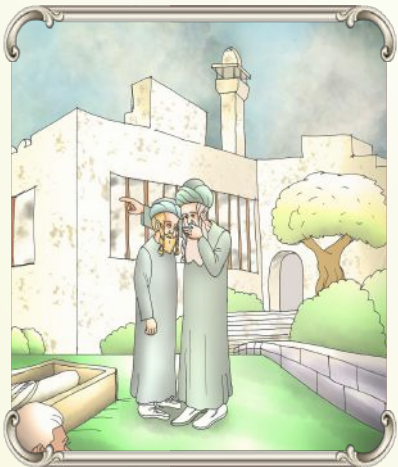
אברהם לחש ליצחק את כל מעלותיה של אמו מאן וצוה עליו להעביר זאת לרבקה, שהיא כבתו של אברהם...

אדם שיש לו קשיות על אשתו ועל רבו, בודאי שיש לו קשיות על ה'. אדם שממרמר מהסביבה שלו בכל מקום, זה סימן שחסר לו נאמנות, והוא חושב שהכל מגיע לו, ובכל פעם לא טוב לו ויש לו מה לבקר. מאידך, אדם שמעריך את כל הטוב, מתוך ידיעה שלא מגיע לו כלום, הוא זוכה לחיים טובים בזה ובבא.