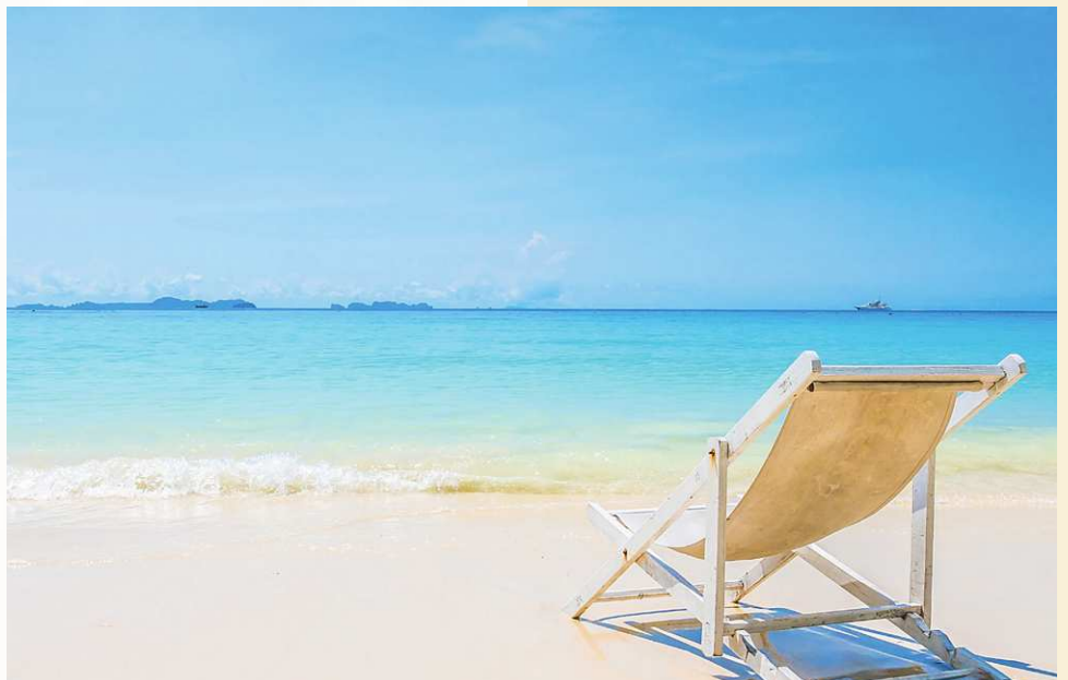
הכסא מסמל את הישיבה וחוסר ההתקדמות, את זה שאתה תמיד נשאר באותו מקום.