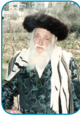
נטל את שמונים וחמש שנותיו, רבי וועלוול

"נקודה מעניינת שראיתי בכל השנים אצל הרב חשין, שהיה מקרב רבות את הספרדים ובני עדות המזרח. הוא היה משקיע בקירובם רבות ומסר נפשו ממש בעד זה. סיפר אביו "אבא! מדוע אנו לא זוכים לקירוב גדול כמו הספרדים?" ואז אמר לו הרב חשין: "תדע לך, שהספרדים הם הכלים הגדולים ביותר לעניין של רבינו הקדוש, העניין של רבינו מתחבר יותר לספרדים, אצלם זה קיים בצורה הטבעית לקבל את עניין הפשיטות והתמימות, ולכן יש להם כלים גדולים ביותר לקבל את האור..." לכפר ונתן מידי יום ביומו שיעורים לבני עדות המזרח.