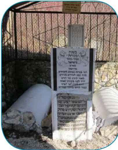
זה לא מספיק. מצבת קדשו של רבי מנחם מענדל

היהודי פנה לרחוב האמור לא לפני שהשביע את בטנו המקרקרת בפרוסת "לקח" וכוסית יי"ש, וניגש אל