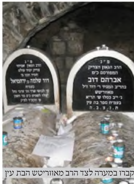
קברו במערה לצד הרב מאווריטש הבת עין

על מצבתו נחקק: פ"נ הרב הגאון האמיתי ציס"ע חסיד ועניו מ' דוד שלמה בן ירחמיאל בעמ"ח ספר לבושי שרד וס' ערבי נחל עלה לשמים כב מרחשון ש' תקע"ד לפ"ק.