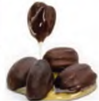
אגוז החוחובה מכיל 54% שמן

גם אם בשמיטה שעברה יכולנו להשתמש כרגיל במוצרי קוסמטיקה ללא השגחה, בשמיטה הנוכחית נצטרך כנראה לנהוג אחרת. על מה ולמה? על כך ועוד במאמר שלפניכם.