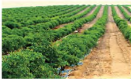
כיום בארץ 25,000 דונם (!) מטעי חוחובה

אלא שעד השמיטה הנוכחית לא היה ביטוי במציאות לחילוק בין שנת השמיטה לשאר שנים, מפני שכמעט לא היה בנמצא שמן העומד לסיכה מגידולי הארץ שנעשה בו שימוש במוצרי קוסמטיקה.