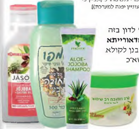
מוצרים שהחוחובה מהיה רכיב ייחודי ומופיע על המוצר

אך יש להקל בזה מצד אחר, דאיסור מסייע הוא דוקא ברכישה מיבול וודאי של 'היתר מכירה', משא"כ כשאין ידוע אם מקורו מגידולי הארץ או מחו"ל, אי"כ הו"ל ספק מסייע שכתבו הפוסקים דאמרינן ביה ספק דרבנן לקולא. 5 [ונראה גם יצרנים בארץ הם בכלל הספק, דאין לומר זיל בתר קרוב, שכן גידולי הארץ נתחדשו בשנים האחרונות, וייתכן שמפעלים ותיקים לא ישנו את הרגלם לרכוש חומרי גלם מחו"ל וכמו שנודע לנו לדוגמה בנוגע ליצרן 'יוניליוור' בארץ (בעלי מוצרי 'פניקו', 'דאב', ועוד) שמשמש רק מחומרי גלם מחו"ל. (ונציין כי לאחר בירור נרחב, בידינו רשימה חלקית של יצרנים בארץ ובחו"ל המשתמשים בחוחובה תוצרת הארץ. המעוניין יפנה למערכת)]