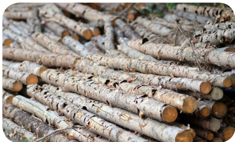
עצים גולמיים לפני הפיכתם לקורות בנין

הירק להכנס לשביעית בלי שיחולו עליו דיני ספיחים. ובאופן זה אכן יש איסור להפסידם קודם שיגיעו לעונת המעשרות.