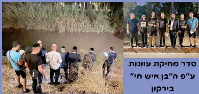
סדר מחיקת עוונות ע"פ ה"בן איש חי" בירקון