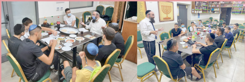
מפגשים לצעירים בבית הכנסת "בית יוסף" גבעתיים