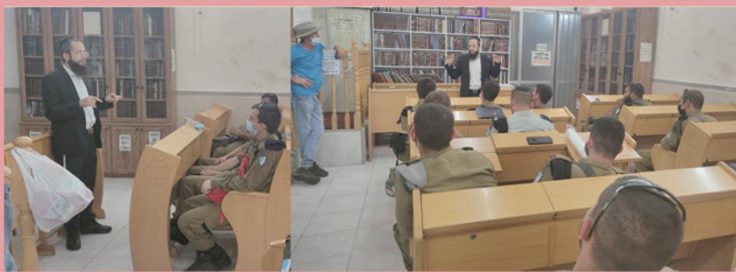
שיעורי התורה בבית הכנסת "אליהו הנביא" בתל אביב