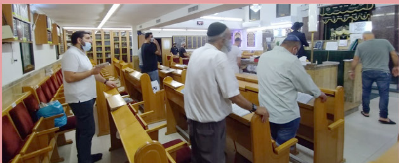
סליחות באשמורת הבוקר בבית הכנסת "בית יוסף"