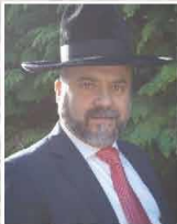
אהוב הקהל הרב משה יזדי שליט"א