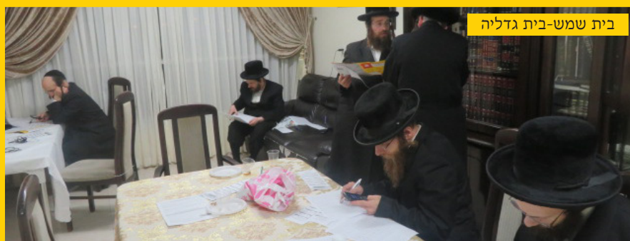
בית שמש-בית גדליה