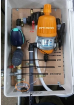
מנגנון השקיה אוטומטי

פסידא: היתר נוסף מצינו במשנה ובגמ' (מועד קטן דף ב, ו) ונפסק ברמב"ם (שמיטה פרק א הלכה ח ז), משקין בית השלחין בשביעית, שמוותר מלאכה דרבנן במקום הפסד, שאם לא ישקה תעשה הארץ מלחה וימות כל עץ שבה, ומלאכת השקיה אסורה מדרבנן. והוסף החזו"א (שביעית סימן כא אות יז), שגם אם לא ייבש העץ אלא ייזקו 'כל פירותיו' מותר להצילו מההפסד. והג"ר זעליג שפירא זצ"ל (קונטרס סדר השביעית אות יג) כתב בשם החזו"א, שאפילו אם ייזקו 'רוב פירותיו' רשאי להצילו מההפסד.