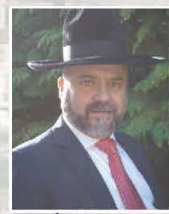
אהוב הקהל הרב משה יזדי שליט"א