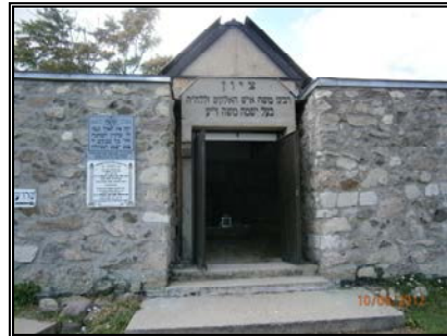
האוהל שעל ציון רבינו זיע"א

בשמאלה בשבילו, כדי שיהיה טמון ממש על יד רבי אלכסנדר סענדר, אך למעשה כשנפטר הישמח משה ביום כ"ח תמוז שנת תר"א הטמינו אותו מימין זוגתו הרבנית, כשלושה שבועות אחר הסתלקותו ביום ח"י מנ"א בנו החברא קדישא, אוהל גדול אחד על קבר הישמח משה ועל קבר הרבנית, וגם ציון רבי אלכסנדר סנדר הכניסו לתוך האוהל, כאשר היה רצונו של הישמח משה שיהיה טמון על יד הצדיק רבי אלכסנדר סענדר, ומאז כידוע לא היה בנו יחידו בעל ה'היכל הברכה' נחא ליה מזה שעשו אוהל אחד, ועל מה שהכניסו את אביו באוהל אחד עם הרבנית אשת הישמח משה, וגם שנראה כאילו קבר הרבנית היא באמצע שני הצדיקים, מאז לא נכנס לתוך האוהל, והקפיד מאוד על הח"ק שעשו כזאת.