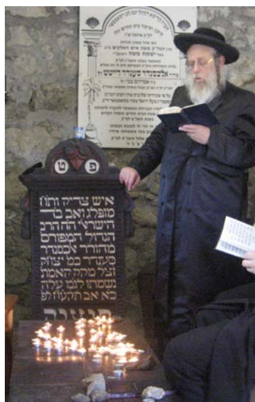
כ"ק רבינו שליט"א מעתיר על ציונו הקדוש

ימים, וכפי שאמר לו מורו ורבו החוזה מלובלין אחר שהבטיחו לבן זכר שלא יזכה להיות עמו בעולם הזה שנים הרבה, ופי שכותב בנו היחיד הברכה' בימגילת סתרים, וכשהיה אבי הצדיק, אצל מורינו ורבינו הקדוש האלוקי ישראל מלובלין, ויפצר בו, שיקבש עליו רחמים שיהיה לו בן זכר, והשיב לו: שבהכרח אם אגזור שיהיה לך בן זכר כן יהיה, אבל לא תאריך ימים, כי לא יהיה לכם ישיבה אחת בעולם, וקיבל אבי על עצמו ומסר לו ייחוד שם אחד נורא ושמות קדושים לכיון בעת היחוד שיוריד את נשמותי, בשנתו האחרונה נדד אל עבר ארץ אונגארין, ולפני זה הרגיש ששם יבוא קיצו ויחזיר נשמתו ליוצרה, וז"ל בנו בהקדמת 'זכרון דברים': וביום נסעו מאצלי למדינות אונגרין, קטן הייתי, ואני והוא ידענו שישתלק שם לעולמו, ובכיתי שבעה ימים ושבעה לילות כמעייין, ורגע שנפרד ממני לדרכו היה לי טעם כפרידות נשמה מן הגוף, וקודם שנסע צוה קודם נסיעתו לדרכו, היאך שאתנהג כל ימי בתורה נגלה ונסתר. בהקדמת 'זוהר ח' מבנו בעל הידמשק אליעזר' מפרט בהרחבה הצוואה שצוה לו, כשיהיה בן שלוש שנה ילבש ביום השבת קודש בגדים לבנים, וכשיבוא לרוב שנותיו לשנת שלוש וחמש, יניח בתפילת שחרית שני זוגי תפילין רש"י ור"ת ביחד.