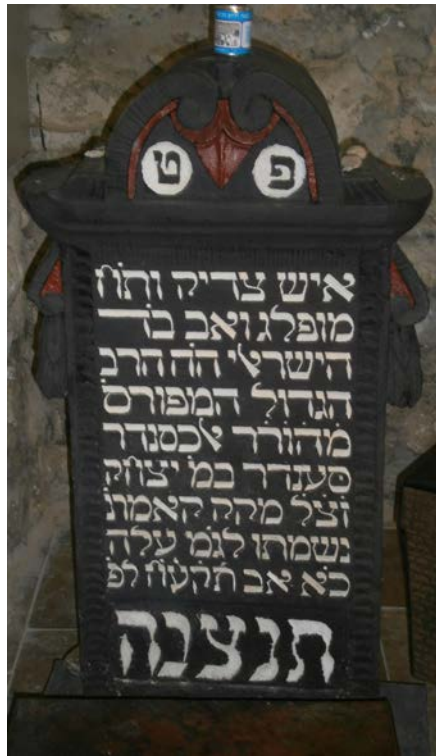
מצבת קרשו של רבינו

ומוסיף שם על דרך לימודו, וז"ל: ומימיו לא השים פניו ועיניו על איזה דקדוקי עניות, ולא השים עינו לחדש פשטים ופלפולים, אלא לשבוע נפש מסלת דאורייתא, הלכה נקיה וברורה, ומרוב בקיאות, ממילא נתחדש לו עניינים נפלאים ונוראים בשיטות עמוקות הפלא ופלא.