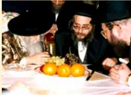
כ"ק מרן רבינו הגה"ק שליט"א בביקור אצל כ"ק האדמו"ר מטאש זצ"ל

ווען רבינו זי"ע האט געזעהן די פעלזן-פעסטן אמונה וואס דער טאהשער רבי, האט