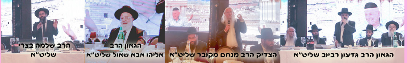
הרב שלמה בצרי שליט"א