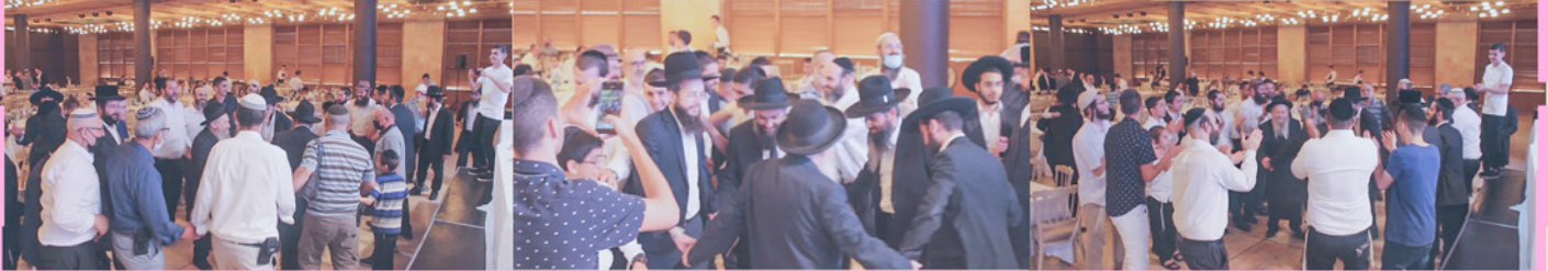
הציבור היקר במעמד המרגש