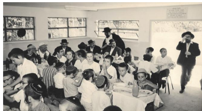
חברת משניות שע"י קהילתנו. בעבר, נערכו שני סיומי הש"ס כל שנה, אחד בכ"ה תשרי בהילולת החת"ס, והשני בחול המועד פסח. כל אחד מהחברים נדרש ללמוד מסכת לסיום.