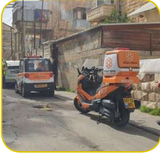
בזכות חסד ואהבת חיים. הרחוב בו נלכד הנחש

כשהאשה עוד בבית, הגיעה בת המשפחה בבהלה אל אמה. הבת, שבימים שאביה שוהה בניו יורק הלכה לישון על מיטת אביה, היתה מפוחדת ואמרה "יש נחש במיטה של באא".