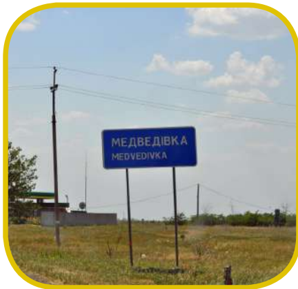
העיר צהלה לשמע הבשורה. מראה הכניסה לעיר מְדוֹיבֵיקָא