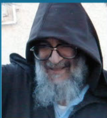
הרב אלעזר אבוחצירא "בבא אלעזר" בנו של רבי מאיר אבוחצירא ונכדו של הבבא סאלי כ"ז תמוז תשע"א (2011)