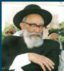
הרב יוסף קאפח חבר בית הדין הרבני הגדול ומנהיגם של יהודי תימן בארץ ישראל י"ח תמוז תש"ס (2000)