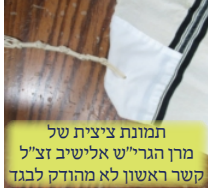
תמונת ציצית של מרן הגרי"ש אלישיב זצ"ל קשר ראשון לא מהודק לבגד

וכתב ה חזו"א (קובץ אגרות חלק א אגרת י, דינים והנהגות פרק ב הלכה א), צריך לומר בהטלת הציצית 'לשם מצות ציצית'. ולשון השו"ת הלכות (סוף הלכות ציצית, בהדרכה סוף