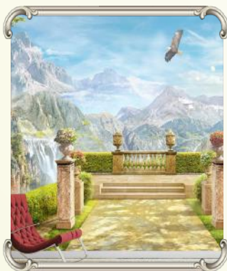
עלינו לעצור ממרוצת החיים, לשבת עם עצמנו ולהתבונן במה להשתפר ולראות את כל הטוב שיש לנו...

למדנו שכל אחד ואחד יכול לשנות את המדות והטבעים שלו, כרבי עקיבא שלמרות שהיו לו טבעים קשים, וכאשר היה עם הארץ אמר מי יתן לי תלמיד חכם ואנשכנו פחמור, מפל מקום הוא שנה את מדותיו, עד כדי כך שהפך להיות מגדולי התנאים הקדושים.