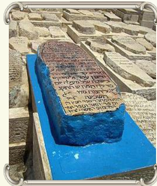
פלשונו האור החיים: אם היו בני האדם מרגישים במתיקות וערבות טוב התורה היו משתגעים ומתלהטים אחריה...

ואמרנו חז"ל (אבות) כל מי שיש בו עין טובה ורוח נמוכה ונפש שפלה, מתלמידיו של אברהם אבינו. מאידך, מי שיש לו עין רעה ורוח גבוהה,