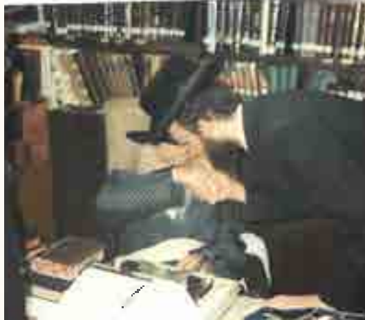
כותב השורות מתברך ע"י אדמו"ר זצ"ל