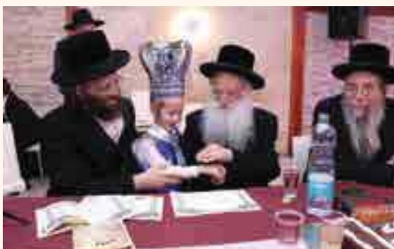
ברכה אישית לכל חתן

השי"ת יעזור שנזכה לעשות את התלמידים וגם אותנו ליהודים, ואז נזכה לכל הטוב.