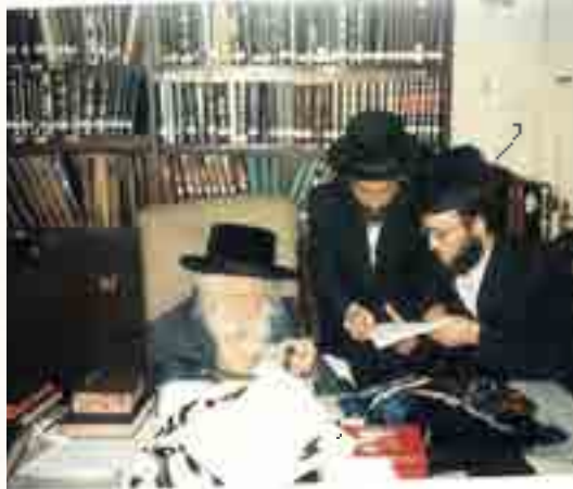
רבינו מציג לכותב השורות דפי זכרונות תולדותיו וגם ההצלה שלו שכתב בימי חורפו לצורך פרסומם ברבים

אחר חתונתו המשיך רבינו בעבודתו הקדושה ובהתמדת התורה והפריש עצמו כליל מן העוה"ז ומהמוניו, והרבנית נטלה על עצמה עול כלכלת הבית, כדי להוריד מרבינו דאגת הפרנסה ועד פטירתה של הרבנית לא ידע בצורתא דחזוי,