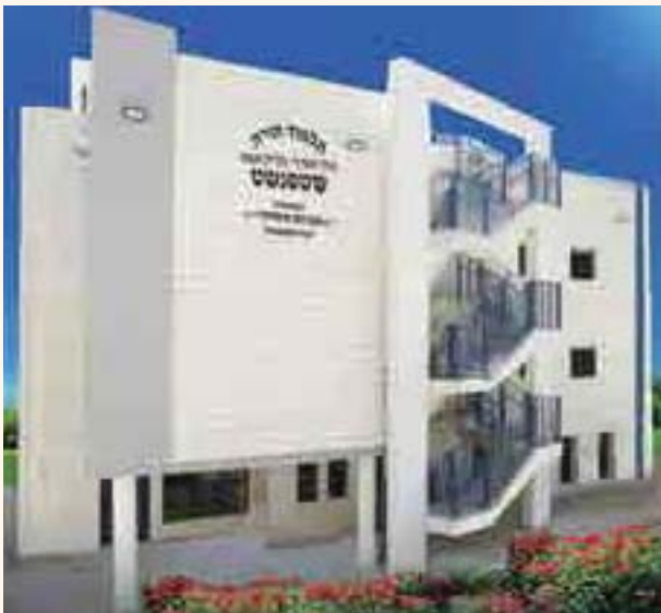
בניין הת"ת החדש - כניסה בחודש אלול תשפ"א

בשנים הראשונות שלי בחינוך ילדי ישראל, נתקלתי בתלמיד מוכשר מאוד, אבל תזזיתי וקופצני במיוחד, עם בעיה של קשב וריכוז, יעצתי להורים יעוץ מקצועי ואבחון, לאחר חודש חל שיפור דרסטי אצל הילד לטובה, ולשאלתי האיך, מה קרה, ההורים הוציאו לי ספר תהילים, התחלנו יום יום לשפוך שיח ודמעות בתפילה להצלחתו. ואני מעיד שזה עשה את שלו ובגדול,