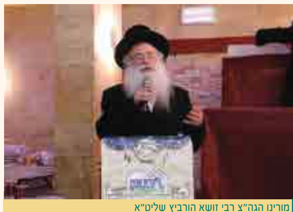
מורינו הגה"צ רבי זושא הורביץ שליט"א

החתנים החשובים מתחילים את תלמודם בפסוק הראשון בפרשת ויקרא, פרשת הקרבנות, ומהו הענין בזה, הנה היה אפשר להתחיל לתלמוד עם הילדים בפסוקי יציאת מצרים, או בפסוקי מעשה בראשית, אבל זה לימוד שבא בקלות, אבל לימוד קדשים, הרי זה מהמקצועות הקשים בתורה,