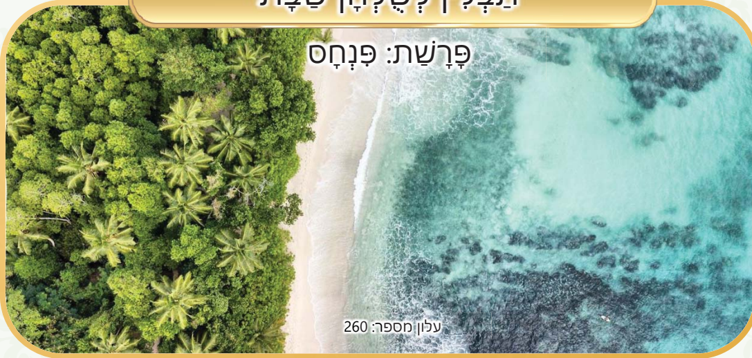
עלון מספר: 260

נא לא לקרוא בשעת התפילה וקריאת התורה. העלון טעון גניזה. הלימוד בשבת פי אלף מיום חול.