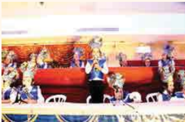
נציג החתנים באמירת אינגלע אינגלע

ברכה מיוחדת אברך את רב הקהילה הרב סלמון שליט"א, את המנהל החינוכי הרב מנחם וייס שליט"א שמוסרים את נפשם עבור הצלחת התלמוד תורה, מתוך תחושת שליחות, ובי"ה שאנו זוכים לראות את הפירות.