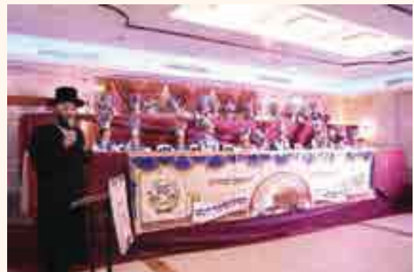
רב קהל שטפנשט בדברי ברכה

בכל השנים היינו מדברים בתקוה ובתפילה על הבנין שעומדים לבנות, ב"ה הבנין כבר קיים, וכבר קרוב ממש לאכלוס, הבנין כבר מוכן, ונקוה לזכות בקרוב לברך על המוגמר בחנוכת הבית, התלמוד תורה ב"ה עולה מעלה מעלה מחיל אל חיל, וזוהי זכות גדולה שיש לנו, ואנו תולים זכות זו בזכות הצדיק שעל שמו נקרא הבית הגדול והקדוש הזה.