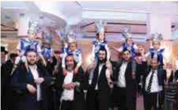
חתני השמחה בריקוד

מכאן אנו רואים את כח ומעלת התפילה של הורים על ילדיהם, הדרכי נועם מביא שבזמן הדלקת נרות שבת של האמהות בערב שבת, הן נמשלות לכהן גדול שמדליק המנורה בבית המקדש... וראוי לנצל ולכוון בעת רצון.