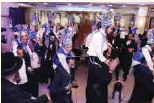
החתנים על כתפי ההורים בסיום המסיבה