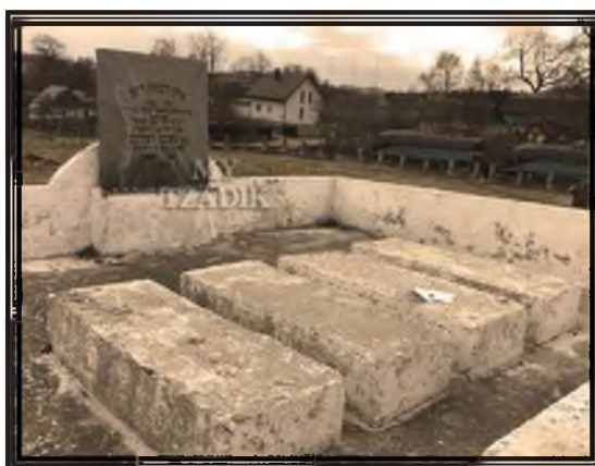
חלקת הקברים מקום מנוחת רבינו חיים מוולוז'ין

מלבד עצם הרבצת התורה והפצתה, מטרה נוספת היתה לרבינו בהקמת הישיבה, והיא להשריש את דרך הלימוד שקיבל מרבו הגר"א, אשר היא שונה מהסגנון שהיה מקובל בקרב רבים, להתמקד בפלפולים שאינם