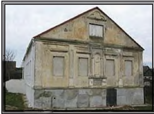
הישיבה בצד רוחבה

ר' יוסף מקריניק תלמיד הגר"ח כתב במכתב משנת תרכ"ה: "בן ע"ח שנה אנכי היום... והתבוננתי שמקודם, טרם הוסד בית ה' ע"י רבינו הקדוש, היה העולם שומם, תהו ובהו ממש, כי לא נודע אפילו שם ישיבה, ומהו הענין של ישיבה ומה עושים בה, וגם לא נודע שם תלמוד תורה דרבים, כי היה העולם שומם מתורה, וגם ספרי ש"ס לא היו נמצאים בעולם כלל כי אם אצל יחידי סגולה גבירים מפורסמים, ואפילו בבהמ"ד מעיירות גדולות לא נמצא ש"ס שלם, כי לא היה נצרך בעולם מחמת שלא היו עוסקים בהם, וכשיסד רבנו את הישיבה, נתבקשו גמרות הרבה, והוצרכו לשלוח לעיירות גדולות ולקבץ גמרות לצורך בני הישיבה... ובשנה הראשונה שהוסד בית ד' בוולאז'ין, וראיתי שהרבה סוחרים הקיפו את דרכם להיות בוולאז'ין, לראות מהו הענין ישיבה, ומה עושים שמה, וכראותם שכמה מניינים מופלגי תורה יושבים ולומדים כל היום וכל הלילה בשקידה נפלאה, נשתוממו והתפלאו מאד על זה, שלא ראו ולא שיערו כזה, והרבה סוחרים שהו כמה ימים ולא רצו ליסע משם". (מובא בתולדות רבנו חיים עמ' 33)