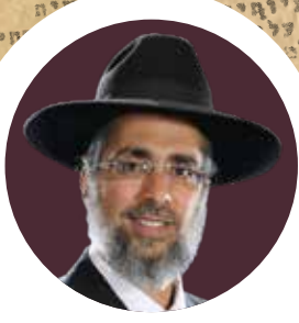
הוא הסתכל עלי בעיניים זועמות ואמר לי: הרב שמואל, תשמע טוב,

מאת מרגן ורבנן גדולי הדור זצ"ל, ראשי ורמ"י ישיבת פוניבז' לצעירים לפני למעלה מיובל שנים, המפרטים את סדרי הלימוד והאופן הנדרש ללימוד בישיבות הקטנות.