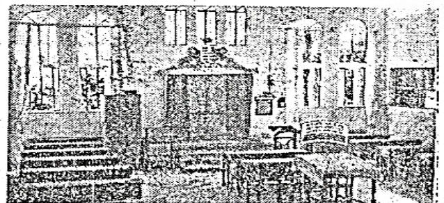
חלק הפנימי של ביהמדר"ר הגדול בזכרון מאיר