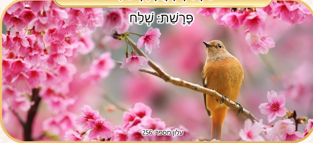
עלון מספר: 256

נא לא לקרוא בשעת התפילה וקריאת התורה. העלון טעון גניזה. הלימוד בשבת פי אלף מיום חול.