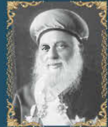
הרב יעקב מאיר ט' סיון תרצ"ט (1939) הראשון לציון, והרב הספרדי הראשי הראשון של ארץ ישראל במסגרת הרבנות הראשית