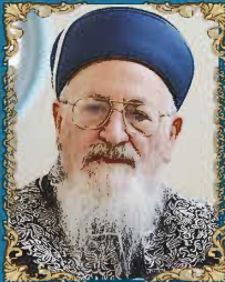
הרב מרדכי אליהו כ"ה סיון תש"ע (2010) הראשון לציון והרב הראשי לישראל, מקובל ופוסק הלכות.