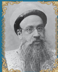
הרב אליהו בכור חזן כ"ב סיוון תרס"ח (1908)

הראשון לציון והרב הראשי לישראל, מקובל ופוסק הלכות.