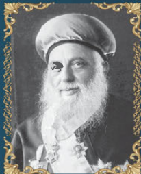
הרב יעקב מאיר ט' סיוון תרצ"ט (1939)

מייסד ישיבת "אוהל מועד" בירושלים וחבר בית הדין של יוצאי ארם צובא