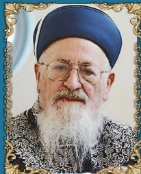
הרב מרדכי אליהו כ"ה סיוון תש"ע (2010)

הראשון לציון והרב הראשי לישראל, מקובל ופוסק הלכות.