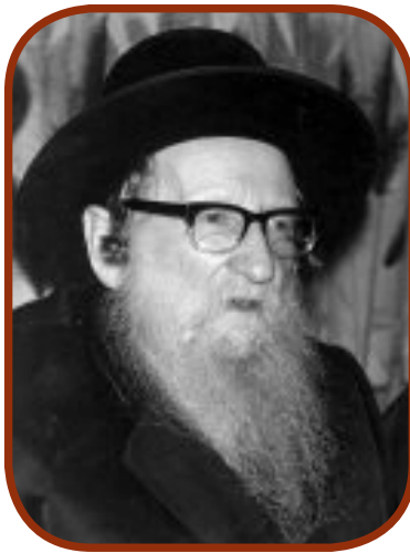
פסקים מקובלים בבית דין העליון. ה"מנחת יצחק"

"קטרוג גדול נתהווה בשמי מעל לאחר שאותו גדול בישראל הכריע כי הבתים האמורים פסולים לברכה. על