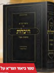
ספר ביאור הגר"א על היכלות בראשית - פקודי ז"ל ע"י הוצאה לאור צוף