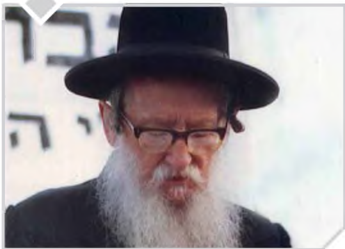
בי"א בסיוון תשמ"ט נתבקש לישיבה של מעלה, ונטמן בהר הזיתים בירושלים.

העיסקה בין מרנן הגרי"י וייס והגר"י קניבסקי זצ"ל • חיבורו הראשון שמעולם לא התפרסם • כיצד גילה הרב וייס את הזיוף בשטר ההלוואה? • ומה גרם לרבי שלמה זלמן לרקוד בעיצומו של יום חול?