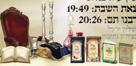
האלון נרכש לפני שנים: מורה בת נעשה - לקח לי ומסרה בת נעשה - אמת כחן וכן לפני שנים מספרים בן אלו ומספרת