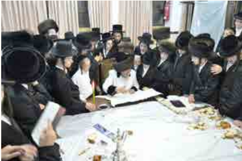
נכדו האדמו"ר מסקאליע שליט"א, ניתן להבחין בשטריימל עם הכיפה המוגבהת כפי שנהגו גם צדיקי בית סקאליע לילך כך מאז שהרה"ק רבי אליעזר חיים זצ"ל נתגדל כבן יתום בבית הרה"ק משטפנשט זיע"א