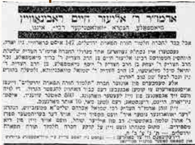
העיתון 'דער יידישע טאגבלאט' לאחר ההסתלקות