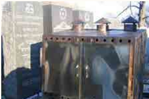
מצבת קברו של רבינו בקווינס ניו יורק

סיפר לי עוד איש אחד שהי' בשכנותו אשה חולה מסוכנת מאד שכל הרופאים הסכימו שאי אפשר לה לחיות ושתמות בודאי תיכף בלי עיכוב כלל. ובא אל אדוני אבי זקני זצ"ל עם פתקא ופדיון נפש, וכשקרא א"א ז"ל הקדוש ז"ל את הפתקא אמר לעצמו: אינני רואה שום רע בהפתקא. והשיב להבא אליו: לך ואמור להם שבודאי תתרפא בעז"ה, וכך הוזה.