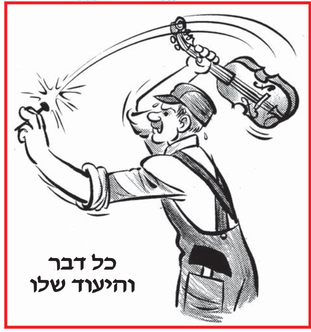
כל דבר והיעוד שלו

פשוט הדבר שצריך לשמוח ביסורים, ומי שחיוו שטופים בשקט ושלוה הוא האומלל, שהרי חסרים לו סיבות לשלמות וקירבת אלוקים. ומצינו שדוד המלך אמר "שבתך ומשענתך הנה יבחמוני". שבתך- יסורים . משענתך- תורה . ב' עניינים אלו הם הנוחם והשמירה בהליכה "בגיא צלמות" והם היוצרים את המצב של "כי אתה עמדי".