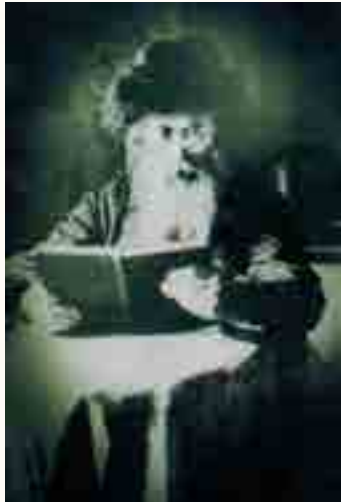
צורת הרה"ק רבי אליעזר חיים לבוש בשטריימל עם הכיפה המוגבהת במנהג אדמורי"י שטפנשט ורוזין בביתו התגדל כבן יתום

התרופה הזאת אשר אני כותב לך ותתן לתוך פיה כל ד' שעות וביום מחר לעת הצהרית אי"ה תבוא עם אשתך אלי. ונשתומם האיש הנ"ל על הדיבורים של הצדיק, ושאל אותו שתי שאלות: א', האיך יוכל ליתן לתוך פיה, כי הלא הרופא צוה שלא יתנו לה לתוך פיה כלום כי תחנק תיכף מאחר שאינה יכולה לבלוע? ושנית, האיך תוכל לבוא מחר מאחר שהיא גוססת היום. והשיבו א"א ז"ל: מה שאמרתי לך תעשה תיכף בלי שום תירוץ, וביום מחר אי"ה תבוא עם אשתך לכאן. והאיש ההוא רץ תיכף וקנה את התרופה ושפך לתוך פיה, ובלעה את התרופה והיה לפלא גדול. ואחר ד' שעות נתן עוד הפעם התרופה לתוך פיה ובלעה ותיכף פתחה את עיניה והתחילה לדבר, ובאמת ביום השני לעת הצהרית עלה לבוא עם אשתו אל הצדיק והאריכה ימים אחר כך.