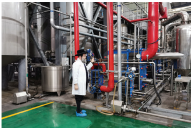
הגאב"ד שליט"א בבדיקה קפדנית במפעל לייצור 'חומרי גלם'