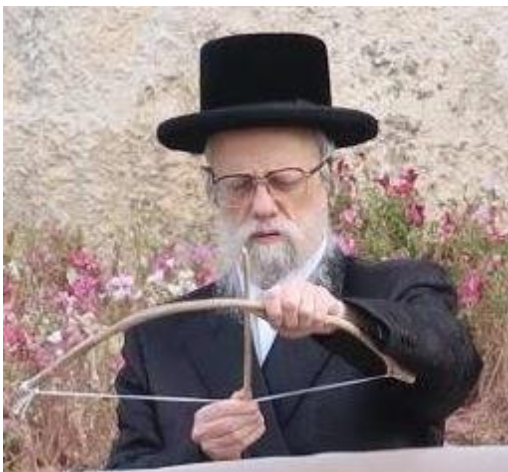
אצל כ"ק מרן אדמו"ר שליט"א