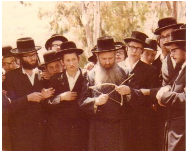
מנהג יחץ וקשת' אצל ה'חכמת אליעזר' זצלה"ה