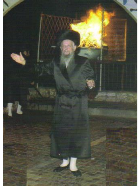
ההדלקה אצל ה'חכמת אליעזר' זצלה"ה