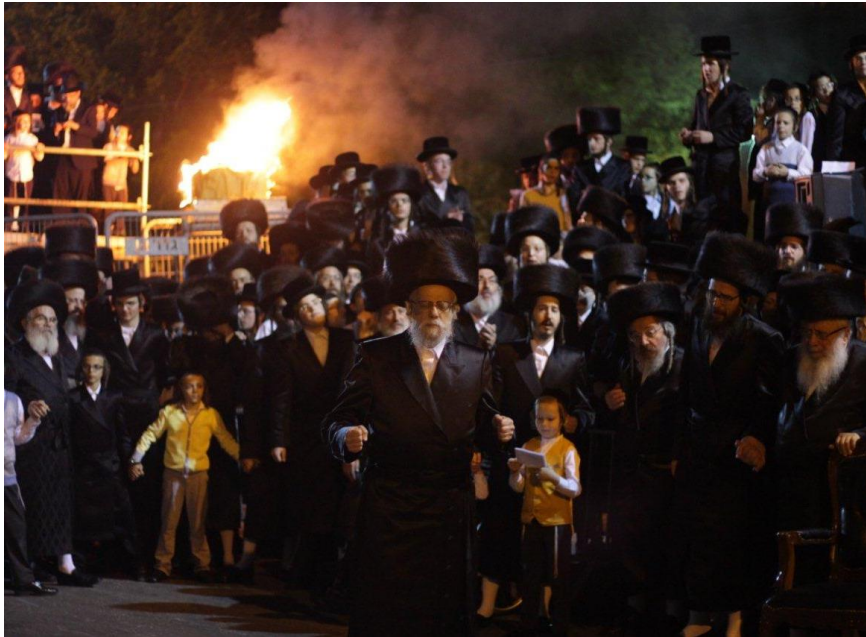
ההדלקה ע"י כ"ק מרן אדמו"ר שליט"א