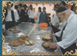
נשיא מועצת חכמי התורה רבינו שלום כהן שליט"א