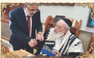
הראשון לציון ורבה של ירושלים רבינו שלמה עמאר שליט"א