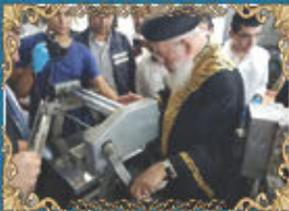
הראשון לציון ורבה של ירושלים רבינו שלמה עמאר שליט"א