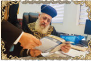
הראשון לציון רבינו יצחק יוסף שליט"א נותן את עצתו וברכתו לרגל הוצאת עלון מספר 1,800

היוצא לאור משנת תשמ"ה (1985) מידי שבוע בעשרות אלפי עותקים ומחולק בכל רחבי הארץ ולקהילות בחו"ל. גדולי ישראל סמכו ידיהם על עלון זה שמפיץ את תורת רבני ספרד והמזרח ומנחיל את מורשת יהדות ספרד המפוארה יחד עם הלכות וזמנים ממרו רבינו עובדיה יוסף זצוק"ל