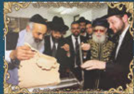
הראשון לציון מרן רבינו עובדיה יוסף זצ"ל