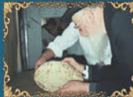
הראשון לציון רבינו מרדכי אליהו זצ"ל