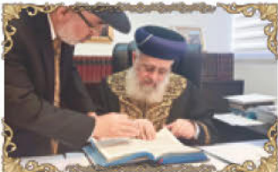
הראשון לציון והרה"ק לישראל רבינו יצחק יוסף שליט"א

מאורעות ט"ו בניסן: בט"ו בניסן, אירעו מאורעות רבים לעם ישראל: ברית בין הבתרים, מלחמת אברהם עם ארבעת המלכים, הצלת אברהם מאור כשדים, בשורת המלאכים לאברהם על הולדת יצחק ולידתו בדיוק שנה לאחר מכן, חלום יעקב עם שרו של עשיו, התגלות הקב"ה למשה בסנה, מכת בכורות, יציאת מצרים, מלחמת סיסרא, הנס גדול בימי חזקיהו המלך ומפלת סנחריב, חלום נבוכדנאצר, הריגת בלשאצר, כתיבת הספרים על ידי המן להשמיד וליל הנדודים של אחשוורוש. בט"ו בניסן ג'תתל"ג, נפלה מצדה והסתיים המרד הגדול של יהודי ארץ ישראל נגד האימפריה הרומית, ששיא חורבנו היה שריפת בית המקדש השני 5 שנים קודם לכן, בשנת ג'תתכ"ח. בט"ו בניסן ג'ת"ד, קיימה אסתר את הסעודה לאחשוורוש והמן וצמחה גאולת ישראל. בט"ו בניסן , מתחילים לספור ספירת העומר ובו ביום הניפו את העומר בזמן שבת המקדש היה קיים והתבואה החדשה הותרה באכילה.