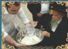
הראשון לציון רבינו אליהו בקשי דורון זצ"ל