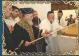
הראשון לציון ורבה הראשי לישראל רבינו יצחק יוסף שליט"א