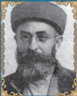
הרב מסעוד חי בן שמעון כ' ניסן תרפ"ה (1925) היה אב בית דין ורבה הראשי של מצרים. תרגם את השולחן ערוך לערבית ספרותית.