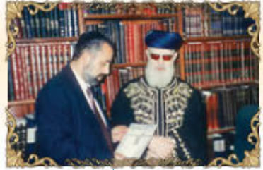
הראשון לציון מרו רבינו עובדיה יוסף זצ"ל עם מייסד העלון הרב שלמה זביחי שליט"א המגיש לפניו את עלון מספר 500