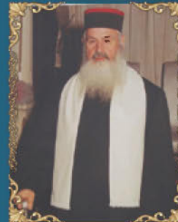
הרב שלום משאש י' ניסן תשס"ג (2003) פוסק הלכות מגדולי רבני עולי מרוקו. היה רבה הראשי של מרוקו ורבה הראשי הספרדי של ירושלים.