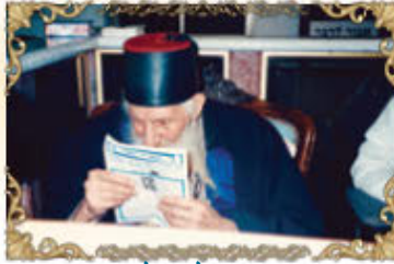
המקובל האלקי רבינו יצחק כדורי זצ"ל קורא את העלון "תפארת רפאל" שהיה מגיע לידיו מידי שבת בשבתו