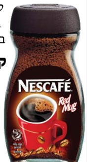
קפה נמס מגורען, לא מיובש בהקפאה

קפה נמס עובר תהליך בישול בהכנתו, ומ"מ יש מחמירים בו יותר מבסוכר. ויסוד הדבר ע"פ דברי הביאור הלכה (שי"ח ה'), דאפילו דבר שנתבשל מתחילה , אם נצלה אח"כ , אסור לשוב ולבשלו בשבת, מפני שהפעולה האחרונה נקבעת בו יותר, וכיון שנצלה אחרי הבישול נידון מעתה כדבר צלוי שאסור לבשלו. [ואמנם דעת הפמ"ג רוב הפוסקים להקל בזה, אך לכתחילה יש לחוש לדעת הביאור האוסר].