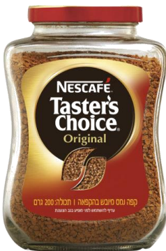
קפה נמס מגורען, מיובש בהקפאה

דקפה נמס רגיל יש בו צד חומרא אפילו בכלי שלישי, וכמו שנתבאר, משא"כ מיובש בהקפאה. [וחשוב להדגיש שאין כאן אלא הידור בעלמא, שכן מן הדין מותר אפילו קפה נמס רגיל בכלי שני, ורק לכתחילה טוב להחמיר בזה לדעת הגריש"א, וכמו שנתבאר. ולא באנו לחילה לאסור המותר, אלא לצייץ שיש הידור ועדיפות למי ששני הסוגים מונחים לפניו, שיש הידור להשתמש בקפה 'מיובש בהקפאה'. וכך מוטו מפי השמועה גם בשם הגר"מ ידלר שליט"א בעל מאור השבת].