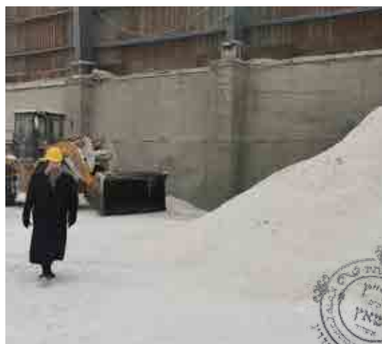
ביקור והשגחה במפעלים בסין. הגאב"ד בביקור במפעל מלח