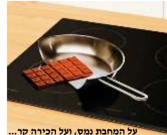
על המחבת נמס, ועל הכירה קר...

נחלקו המנחת שלמה והאגרות משה בנוגע לבישול במקרוגל, מחלוקת שיסודה בגדר היתר בישול בחמה. דעת הגר"ש ז' דטעם ההיתר בחמה מפני שלא נאסר 'בישול' בשבת אלא באש ותולדותיה (דומיא דמשקן), ומאחר שבמקרוגל נעשה החימום ע"י קרינה אלקטרומגנטית על כן הרי זה כבישול בחמה ומותר (מאורי אש עמ' תתנד, וע"ש שלמעשה עדיין אסור משום הפעלת המקרוגל, אך י"ל נפק"מ כשיכוונו מערב שבת עם שעון שבת שידלק לאמן מועט, ויוכל בשבת להכניס אוכל לפני שידלק ולהוציא לאחר שיכבה). אולם דעת האגרות משה (א"ח ח"ג י"ב) שטעם ההיתר בחמה מפני שאין הדרך לבשל בה, ועל כן כתב לאסור בישול במקרוגל מן התורה, דשאני מקרוגל שהדרך לבשל בו.