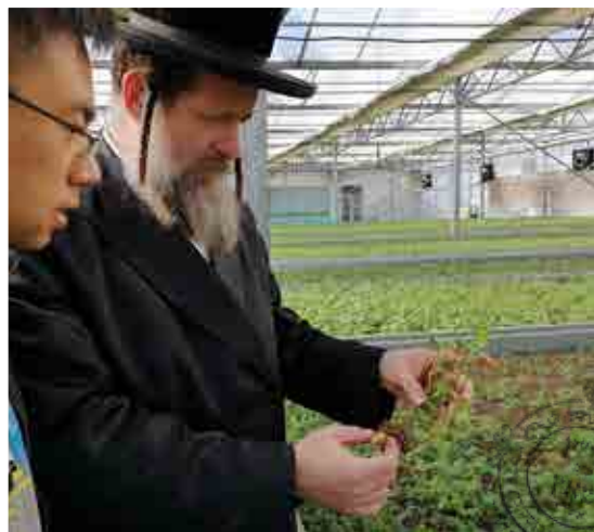
הגאב"ד בביקור השגחה בסין.