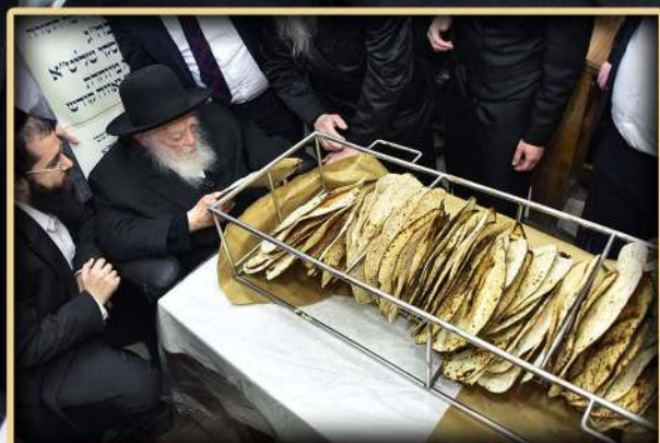
בדיקת המצות ע"י מזן שר התורה שליט"א