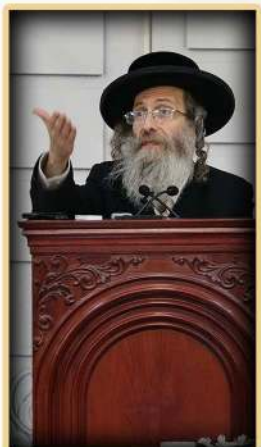
הגה"צ רבי אלימלך בידרמן שליט"א