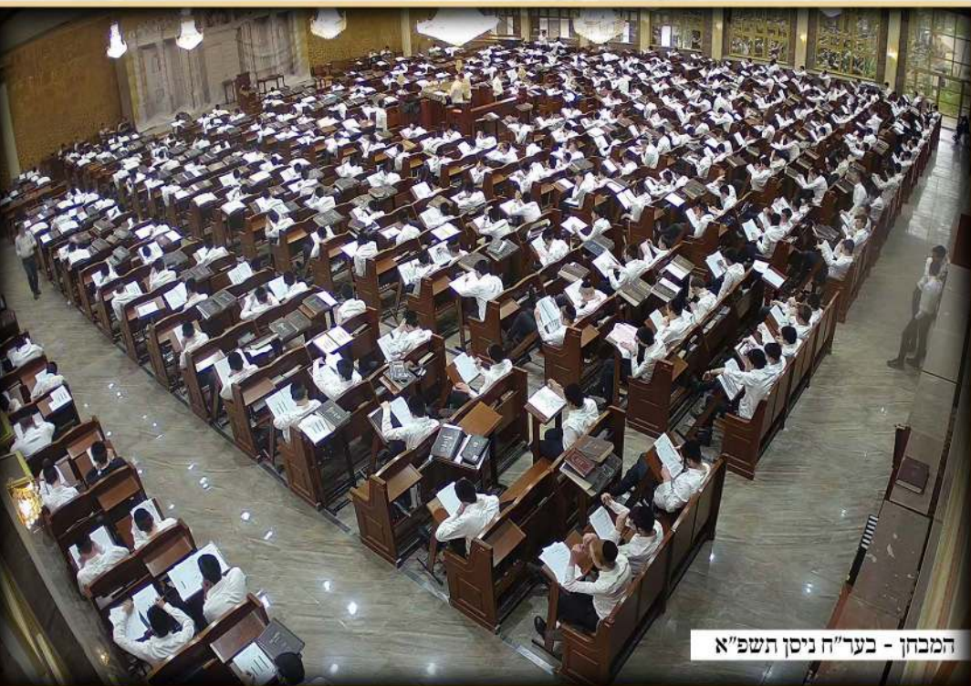
המבחן - בער"ח ניסן תשפ"א