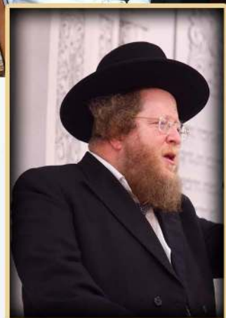
הגאון רבי שלום בער סודוצקין שליט"א