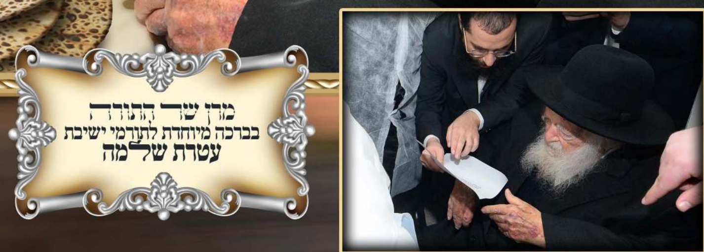
מזן שר התורה במרכה מיוחדת לתורמי ישיבת עטרת שלמה