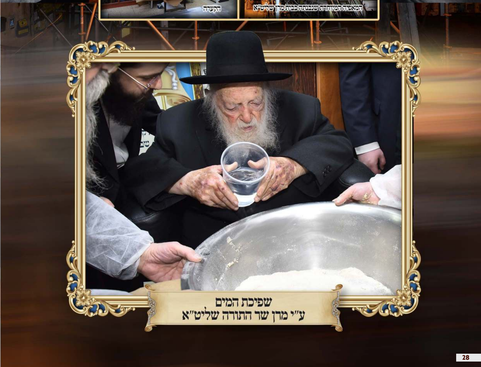
שפיכת המים ע"י מרן שר התורה שליט"א