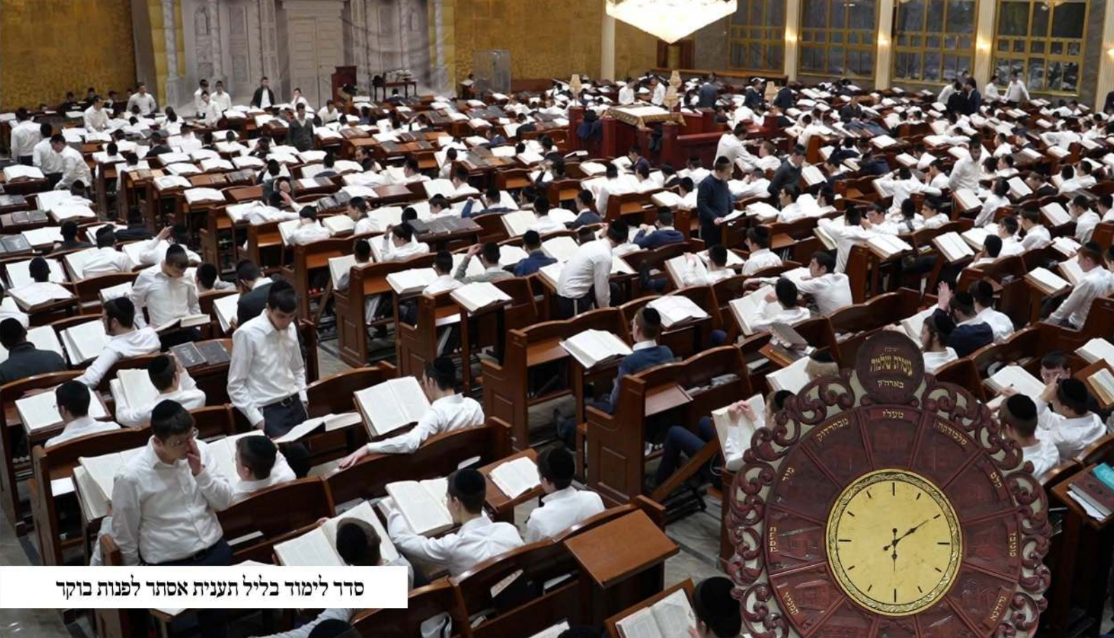
סדר לימוד בליל תענית אסתר לפנות בוקר