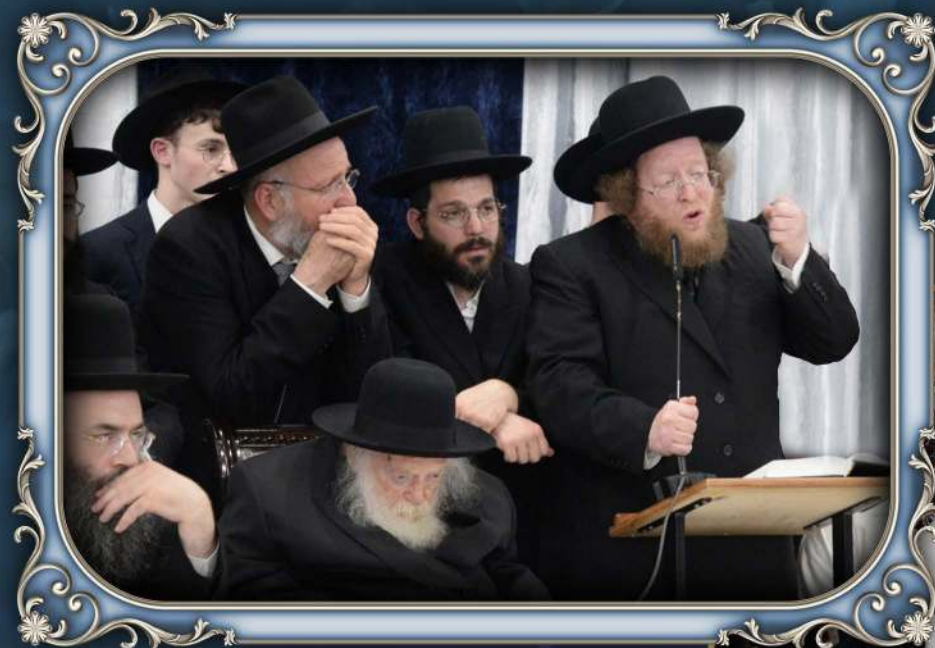
מזן שר התורה שליט"א בשמחת בית השואבה