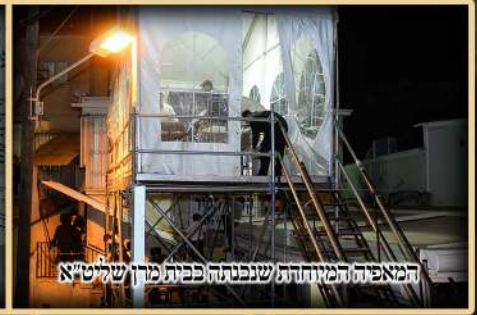
המאפייה המיוחדת שנבנתה לפת מרן שליט"א