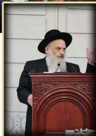
הגאון רבי חיים פינשטיין שליט"א