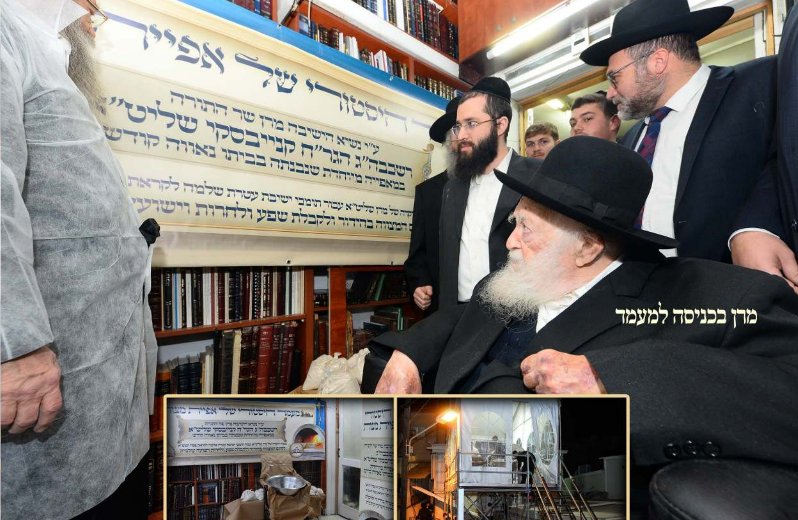
מרן בכניסה למעמד