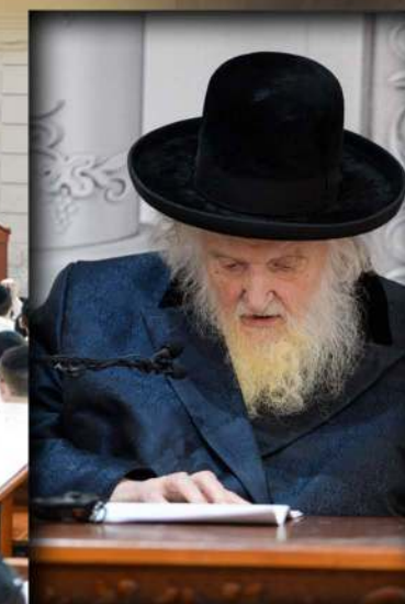
הגאון רבי משה שטרנבוך שליט"א