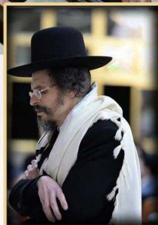
הגאון רבי חיים מרדכי אוכבנר שליט"א