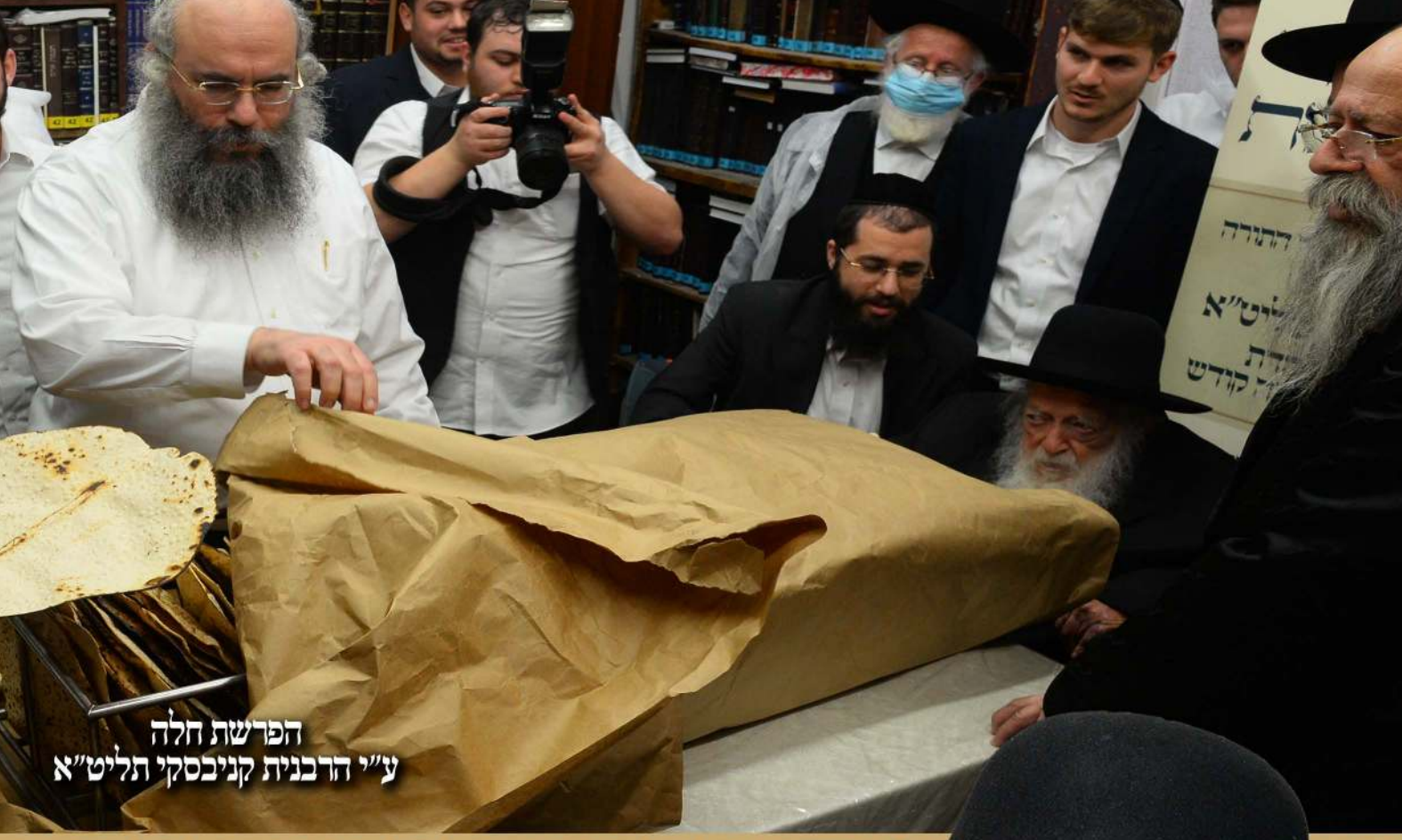
הפרשת חלה ע"י הרבנית קניבסקי תליט"א