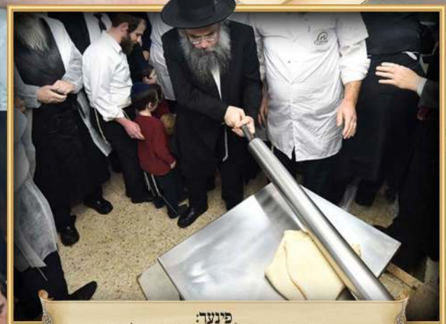
פינער: הנאון רבי שאול יצחק קניבסקי שליט"א