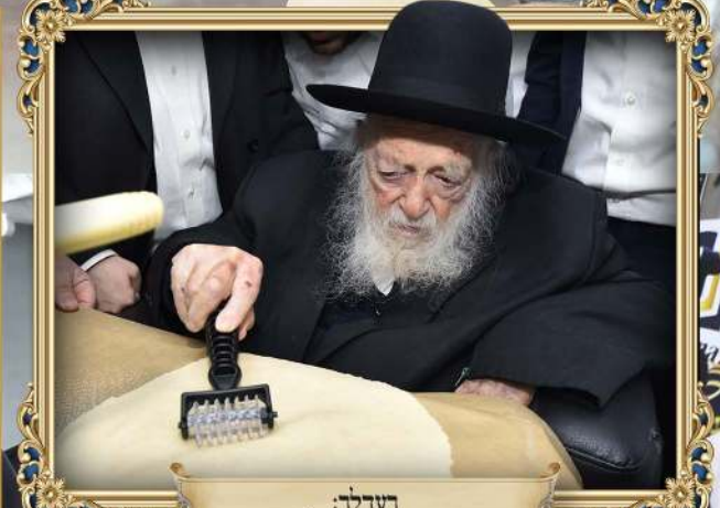
רעלד: מרן שר התורה שליט"א