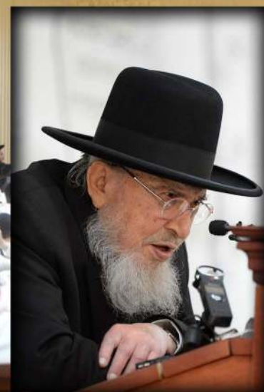
מזן הגאון רבי מרוך מודכי אודחי שליט"א