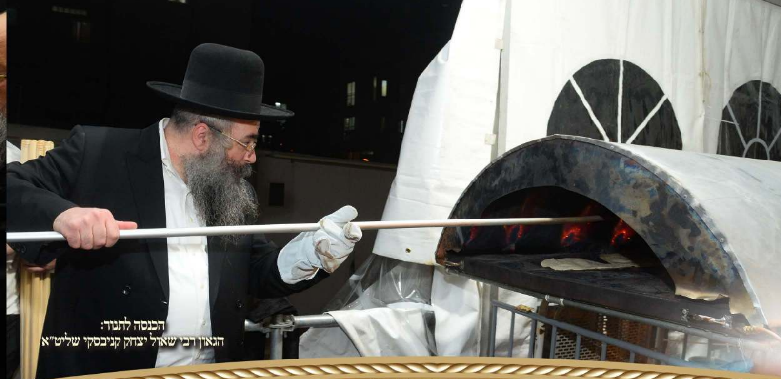
הכנסה לתנור: הגאון רבי שאול יצחק קניבסקי שליט"א