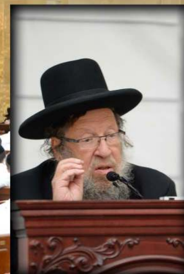
הגאון רבי בנימין סודצקין שליט"א