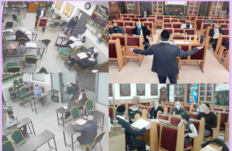
שיעורי התורה המתקיימים מידי יום בבית הכנסת המרכזי "בית יוסף גבעתיים" יהודי יקר! בא והצטרף ללימוד המשותף עם הרבנים שליט"א