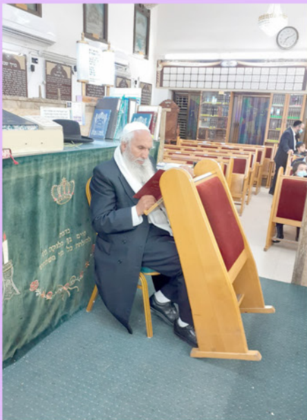
הגאון הרב בנימין מזרחי שליט"א אורח כבוד בבית הכנסת "בית יוסף"