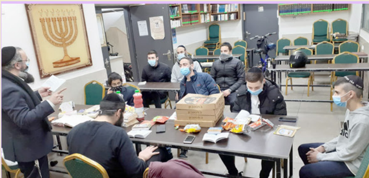
שיעור ומפגש לצעירים עם הרב שלמה בצרי שליט"א מידי מוצאי שבת בשעה 20:30