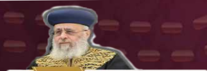
שו"ת הראשון לציון מרן הראשון לציון הגאון רבי יצחק יוסף שליט"א