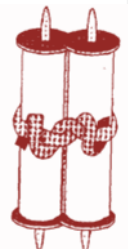
קשר אחד ותחיבת הקצוות

ויש המודעים להלכה זו, ומשום כך אין עושים בחגורת הנביא קשר ועל גביו עניבה, אלא עושים קשר אחד וכורכים את שארית הרצועה בסיבוב, ותוחבים את קצותיה לתוכו. אך עוררו במגילת ספר (כ"א ה), והגר"ש וזנר זצ"ל בקובץ מבית לוי (ט"ו עמ' פ"ט), שקשר אחד וכריכה על גביו גם כן אסורה [עכ"פ כשאין עומדת להפתח באותו היום]. והאופן היחיד שיש בו היתר הוא לעשות כריכה לבד בלא קשר תחתיה, ויכול לכרוך בסיבוב ולאחר מכן לתחוב את הקצוות לתוכה (עי' תורת המלאכות קושר סוף אות ל"ג, בשם ספר זכור ושומר לבעל המחזה אליהו).