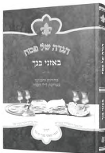
מבית "באזני בנך" להערות והארות, ולהשגת העלון, ניתן לפנות במייל: z6161523@gmail.com

מעתה מבואר לן עד מאוד למה נדרש הכנה כה גדולה לאחוז בדרגה של 'כאילו הוא יצא ממצרים', כי רק עי"ז הדברים יכנסו ויחדרו לנפש צאצאינו שאף הם יגיעו על דינו לדרגה שכאילו הם עצמם יצאו ממצרים.