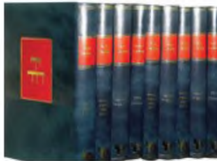
ספרי "יד דוד"

בפקודת השלטונות נדונו כל ספרי הקודש לשריפה. אולם ריד"ז הצליח להחביא את ספריו. באותו פרק מתה עליו אשת נעוריו. ומחשש לחייו, נאלץ ריד"ז לברוח משטרסבורג ולהסתתר עד יעבור זעם, עבר ממקום למקום עד שהגיע לשווייץ, את אשר עבר עליו בימי נדודיו אלה תיאר בהקדמתו: "זיהי בשנת תקנ"ד, באו ימי הפקודה ימי הזעם. פתח ה' אוצרו ויוצא כלי זעמו, אמרנו נגזרנו לנו. ולולי ה' צב' הותיר לנו שריד, כמעט גוענו כולנו אבדנו, כי גזרו כתבו על קרן השור ב"ו, ועל כל הספרים בכתב אשורית שישרפו אותם. ובעו"ה כמה ס"ת וספרים רבים ויקרים נשרפו, ונשסו אוצר כל כלי חמדה, והוצרכתי לגנוז הספרים שלי. ובעת הצרה זועם שבתו עוברי אורח ים תלמוד, ודרכי ציון שוממין, ודלתי העזרה נעלו מתורה ותפילה, ואפילו המשנה השגורה בפי לא יכולתי ללמוד אפי' פרק אחד, ואני בתוך הגולה הולך ונודד מעיר לעיר ומגבול לגבול, עד בחמלת ה' על מין האנושי השבית החיה רעה (-כיניו לרשע רובספייר) מן הארץ ועבר