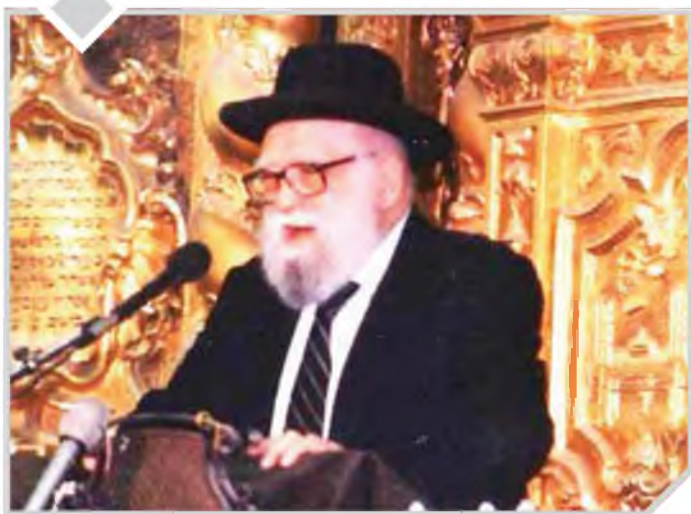
"כי תקנה עבד עברי" (שמות כ"א, ב')