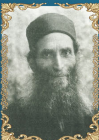
הרב רחמים מלמד הכהן ד' שבט ה'תרצ"ב (1932) היה מרבני שיראז שבאיראן ורבה של יהודי פרס בירושלים. הקים את ביהמ"ד "שערי רחמים" ב-ם.