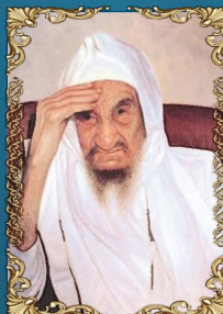
רבי ישראל אבוחצירא ד' שבט ה'תשמ"ד (1984) רבה של מחוז תפילאלת, ומגדולי רבני עולי מרוקו. מודע כבעל מופתים ומוכר בכינוי "הבאבא סאלי".