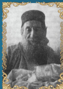
הרב חיים משה אלישר ד' שבט ה'תרפ"ד (1924) היה הראשון לציון וראש הרבנים לעדת הספרדים בירושלים, בנו של הראש לצ"צ הרב יעקב שאול אלישר.