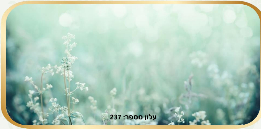
עלון מספר: 237

בס"ד. נא לא לקרוא בשעת התפילה וקריאת התורה. העלון טעון גניזה. הלימוד בשבת פי אלף מיום חול.